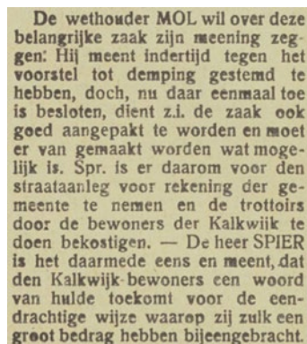
Dedemsvaartsche. Courant, 28-05-1924