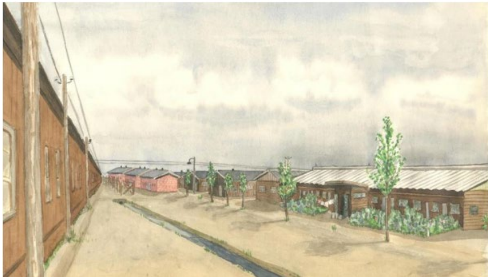
Tekening van het kampterrein in 1943 met rechtsvoor barak 48