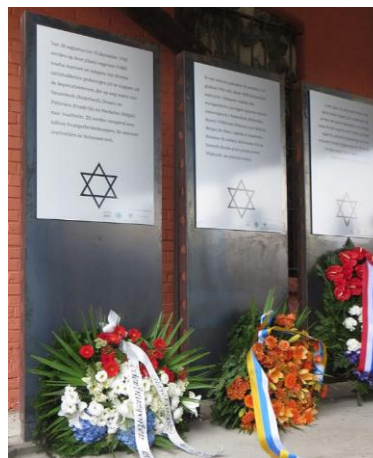
Het stationsgebouw van Cosel (Koźle) met het monument voor de vermoorden.

Uit 18 transporten uit Westerbork werden op deze manier ongeveer 3500 Joodse mannen geselecteerd. Slechts 180 van hen overleefden de oorlog. Uit het transport van 30 oktober 1942 van in totaal 659 personen werden ongeveer 200 mannen, waaronder Isaac Leman geselecteerd. Van velen is onduidelijk waar en wanneer ze precies zijn omgekomen. Dat geldt ook voor Isaac Leman. Van hem kan alleen gezegd worden dat hij uiterlijk op 31 maart 1944 in één van die arbeidskampen in de wijde omgeving moet zijn omgekomen. Daarom staat straks op zijn struikelsteen als sterfdatum: 31 maart 1944, Midden-Europa . Wat er met Telka, Betje en Leo Leman is gebeurd, is duidelijker. Met het transport van maandag 2 november 1942 vertrokken ze, drie dagen na hun man en vader, naar Auschwitz. Direct na aankomst zijn ze alle drie in de gaskamers van Auschwitz-Birkenau omgebracht. Op hun steentje staat straks te lezen dat ze op 5 november 1942 in Auschwitz zijn vermoord.