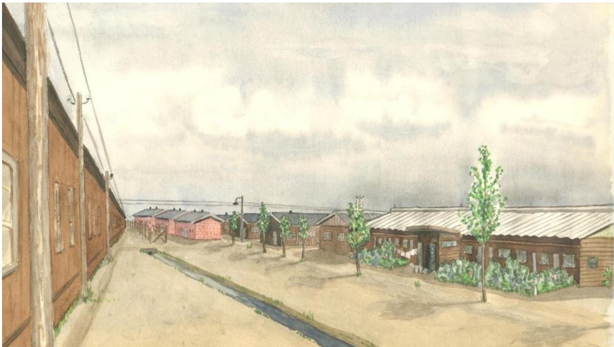
Tekening van het kampterrein in 1943 met rechtsvoor barak 48.