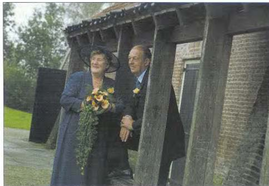
Het bruidspaar dat op hun huwelijksdag lid werd van de HVA en onze vereniging daarmee over de 1300 leden "tilde".