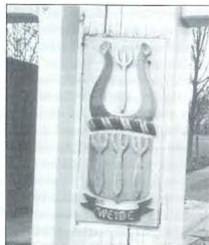
Detail van het toegangshek van "Erve Weide" in Ruinerwold.