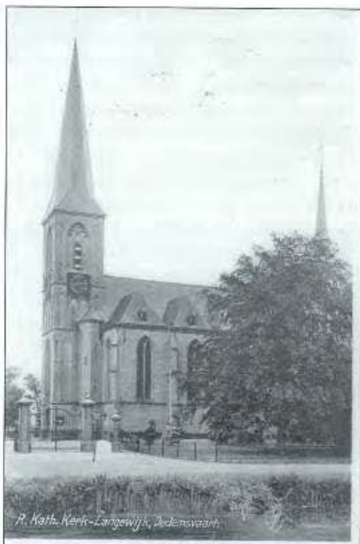
De Roomsche-Katholieke Kerk in Dedemsvaart omstreeks het jaar 1935.

Toen deze in Juni 1927 tot pastoor benoemd werd van