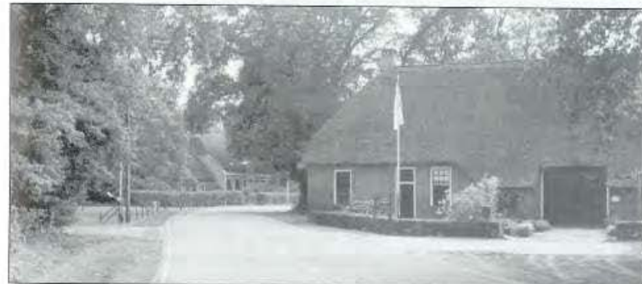
"De Wheem", het vroegere parochiehuys.