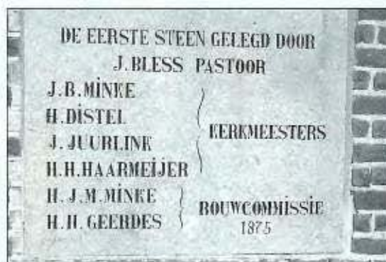
De eerste steen gelegd door Pastoor I. Bless.

Was de parochie in 1819 begonnen met 39 communicanten, dit getal was in 1842 reeds aangegroeid tot 825. Toen in 1842 de parochie Slagharen werd opgericht, bleven er van Avereest nog slechts 400 communicanten over. Dit getal bleef (met eenige schommelingen) vrijwel constant tot het begin dezer eeuw (20 de eeuw). Toen begon wederom een gestadige toename en in 1920 was het getal 700 wederom overschreden. Onmiddellijk hiermede ging gepaard een nijpend plaatsgebrek in het kerkgebouw en al