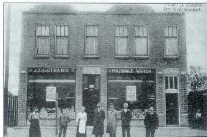
Het filiaal van J. Zijlstra Hzn. te Dedemsvaart.