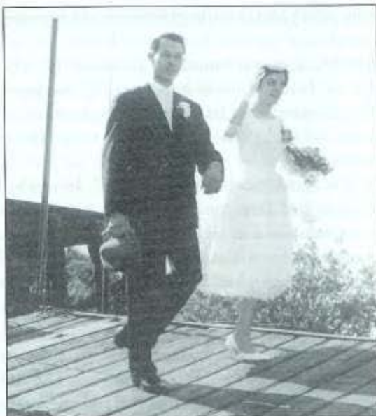
Collectie Gerrit Klein