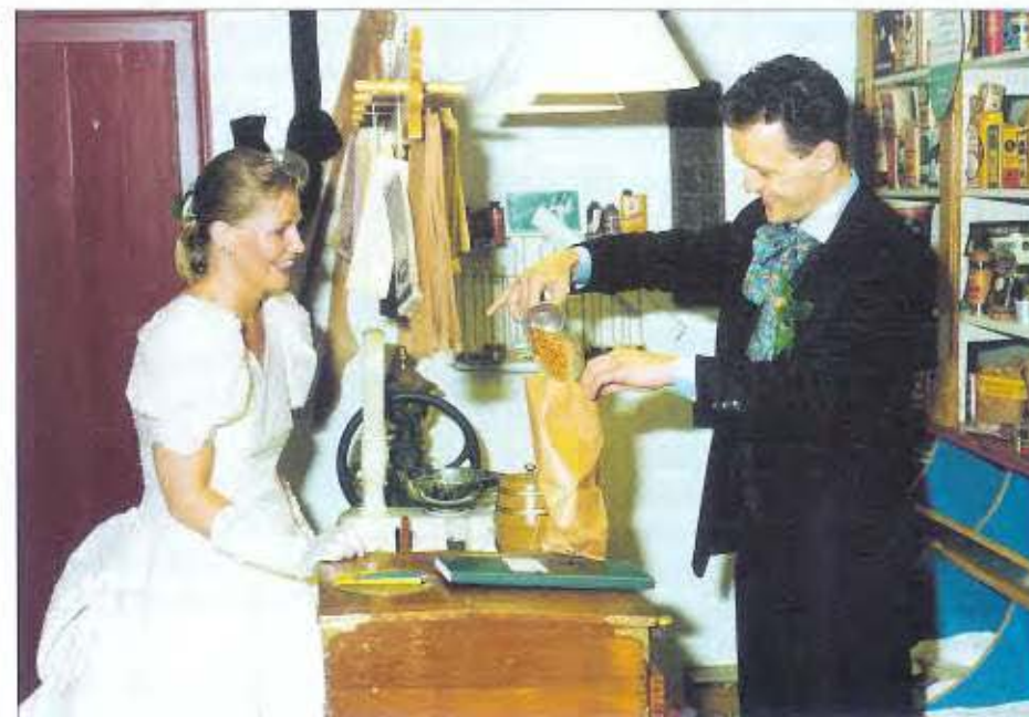
Poserend bij het winkeltje in de oudheidkamer.