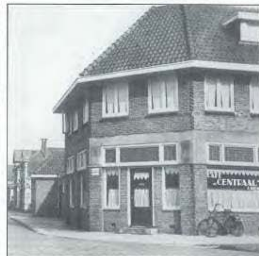
Voor de jaarvergadering van de Verz. Maatsch. van IJzeren Schepen kwamen de schippers bijeen in hotel "Centraal" (nu reisbureau "De Globe").